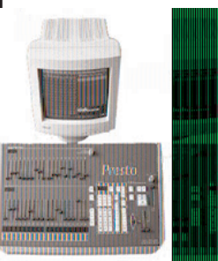
STYRNING FRÅN VALFRITT DMX-LJUSBORD